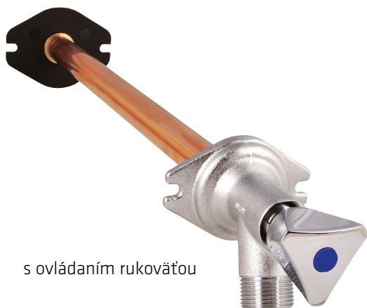
s ovládaním rukoväťou