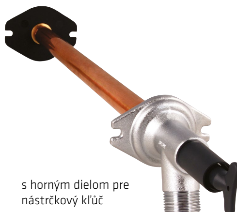
s horným dielom pre nástrčkový kľúč